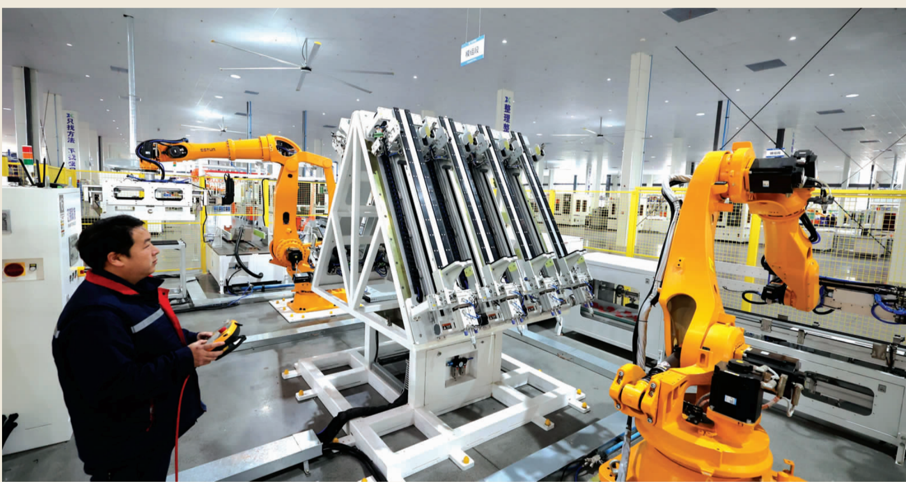
新能源汽车电池订单赶制忙