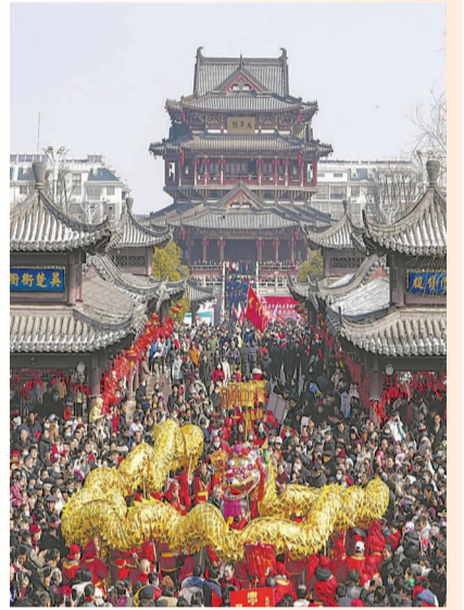
来自南京、合肥、滁州等地游客纷纷走上全椒太平桥。