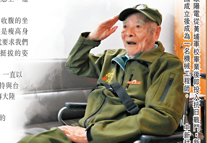
◆歐陽電從黃埔軍校畢業後即投入抗日戰爭。