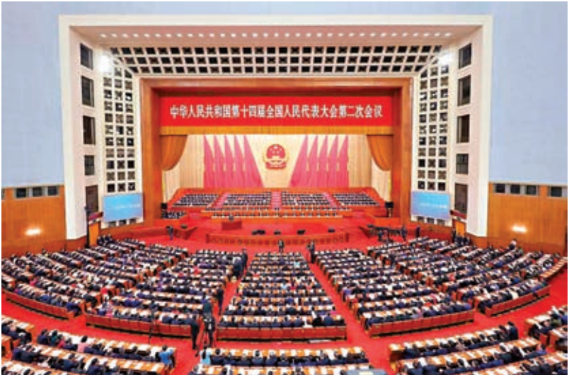
◆3月5日，第十四屆全國人民代表大會第二次會議在北京人民大會堂開幕。