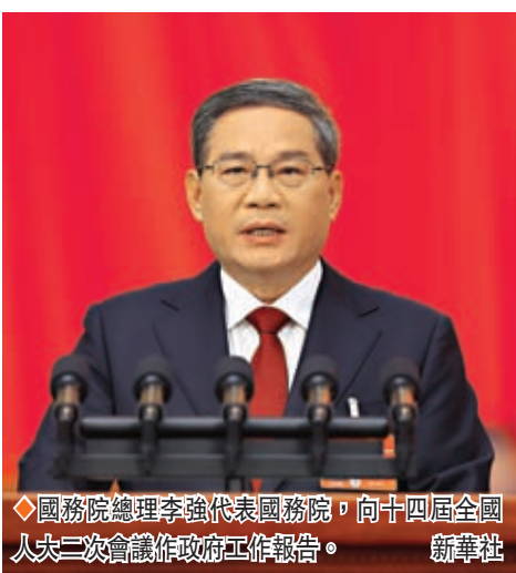
◆國務院總理李強代表國務院，向十四屆全國人大二次會議作政府工作報告。

香港文匯報訊 據新華社報道，3月5日上午9時，十四屆全國人大二次會議在人民大會堂開幕。國務院總理李強代表國務院，向十四屆全國人大二次會議作政府工作報告。