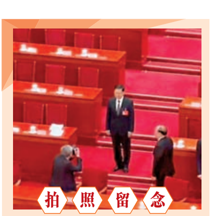
十四屆全國人大二次會議5日上午在人民大會堂開幕，國務院總理李強向大會作政府工作報告。開幕會後，其他主席台成員離席，香港特區行政長官李家超和澳門特區行政長官賀一誠留在原地，一一拍照後再合影留念。