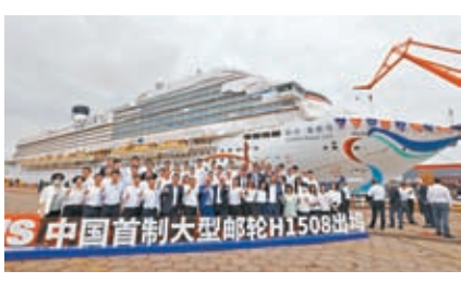
◆2023年6月6日，中國首艘國產大型郵輪「愛達·魔都號」順利出塢。