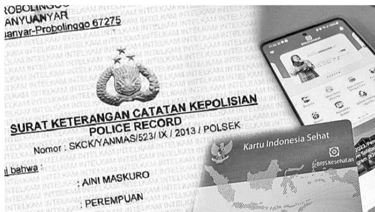
卫保局会员自2024年3月1日起,成为获得无犯罪记录警察证明条件之一

【本报讯】人力资源发展与文化统筹部提高社会福利方面部长助理努依(Nunung Nuryantono)于3月4日表示,卫生保健社会保障机构(卫保局/BPJS Kesehatan)会员资格从3月1日为获得无犯罪记录警察证明(SKCK)必要条件之一,这是本部通过卫保局系统,在医疗卫生保健方面的合作,以期提高社会民众的福利生活。