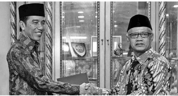
佐科维总统向海达尔(右)表示祝贺

【本报讯】3月4日,在雅加达国家图书馆举行的《宗教节制的新方式:感恩海达尔·纳希尔66寿辰》新书发布会上,佐科维总统在视频演讲中表示,多元化的印度尼西亚迫切需要温和精神以寻求中间道路。温和精神是基于中间道路的哲学,寻找平衡点,找到中间道路的解决方案,这是一个