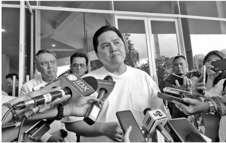
埃里克:政府要求北塔米纳保持燃油价格

【本报讯】政府要求北塔米纳国油公司在2024年上半年末或2024年6月之前,先别提升燃油售价。