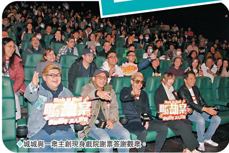
城城與一眾主創現身戲院謝票答謝觀眾。

問到小朋友有沒有看他演出，城城說：「暫時未看得，不過在家有讓她們看宣傳片，她們見到我中槍倒地都有喊，她們不是被嚇親，只是情商高很傷心。」城城又感謝劇照攝影師提早送他角色的巨型照片，所以小朋友都認到劇中角色原來是爸爸，待她們長大後一定會讓她們重看。至於電影上映場次不及其他電影，但仍贏得不少口碑是否是預料中事，城城深思一陣子後，以戲中金句「多謝」做回應。