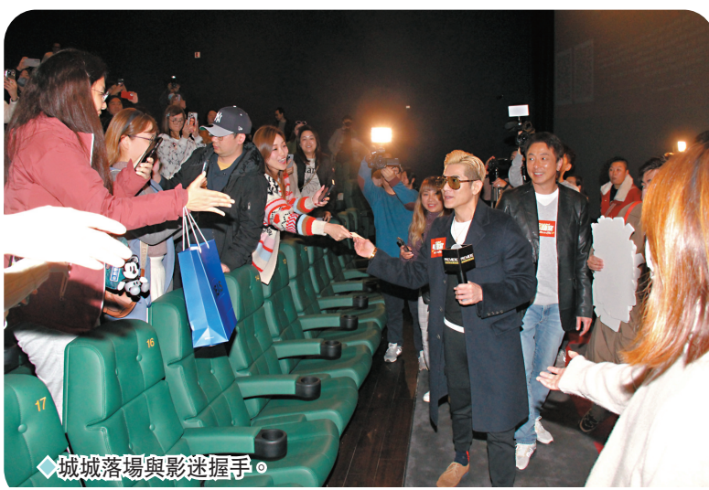
城城落場與影迷握手。