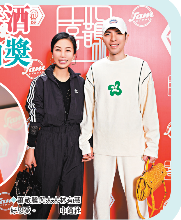
蕭敬騰與太太林有慧同場。