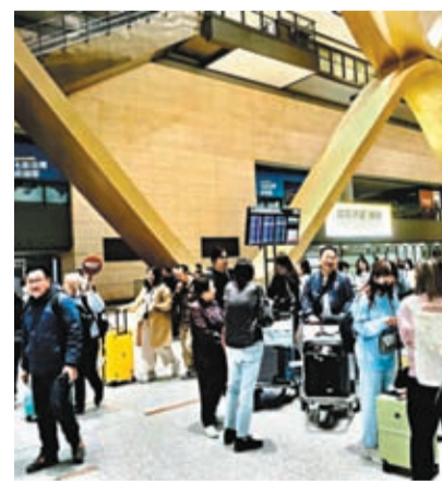
◆3月1日首批泰國免簽旅客順利入境。香港文匯報雲南傳真

此外，繼馬來西亞之後，今年2月9日，中國和新加坡互免簽證正式生效。據《聯合早報》報道，「支付寶+」2月27日發布的數據顯示，農曆新年假期7天中，中國旅客使用「支付寶+」在新加坡的消費比去年同期增加7倍，帶動該國零售、餐飲和其他旅遊相關行業消費。新加坡駐華大使館在其社交媒體上表示，免簽協定將加強兩國民間聯繫，促進相互了解，並為新加坡和新加坡人帶來更多經濟機會。