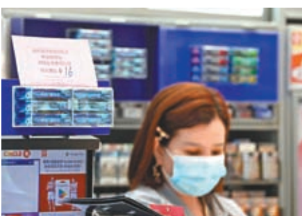
◆ 煙草稅即日起加 32%，香煙零售價每包加 16 港元。

今次是政府連續第二年增加煙稅，去年每支煙的稅款上調 0.6 元，加幅 31.48%，今年加幅則為 31.92%。政府消息人士指出，以市面常見一包香煙 20 支計算，去年加稅後每包香煙稅款為 50.12 元，平均零售價 77.69 元，煙草稅佔煙零售價的比例約為 65%。今次加稅後，每包香煙的稅款為 66.12 元，估計平均零售價為 93.68 元，