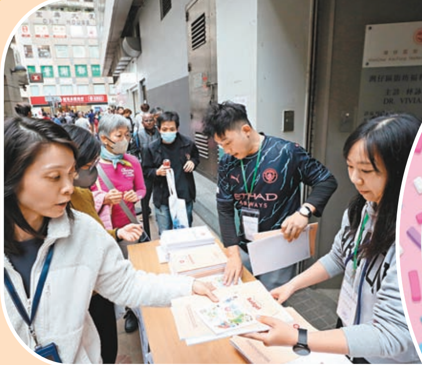
◆ 年薪 500 萬港元以上的部分，薪俸稅率由 15% 增至 16%。圖為市民爭相索取財政預算案。