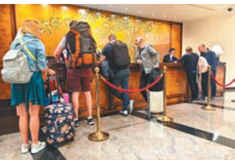
◆ 酒店房租稅明年元旦起復收 3%。

香港文匯報訊（記者 聶曉輝）新預算案在相隔 16 年後復徵酒店房租稅。香港財政司司長陳茂波 2 月 28 日宣布，建議明年 1 月 1 日起復徵 3% 酒店房租稅，讓酒店及旅遊業有更多時間準備，預計政府收入每年可增加約 11 億元（港元，下同）。特區政府消息人士透露，只要是提供住宿服務的房間都要繳稅，時鐘酒店及「宅度假」（Staycation）都要徵稅，估計全港有 317 間酒店及 188 間賓館列入徵稅範圍。