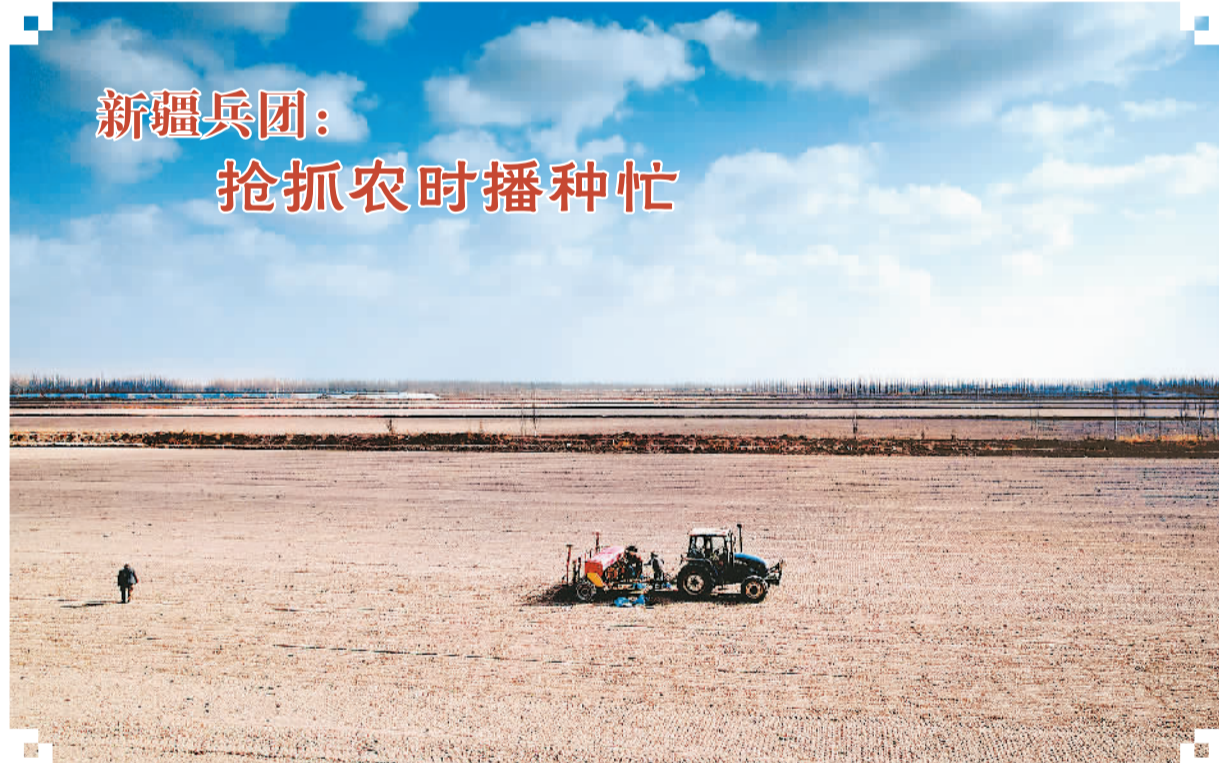
连日来，随着当地气温的回升，新疆生产建设兵团第二师铁门关市焉耆垦区各团镇，抢抓农时进行土地平整、播种春小麦等农事作业。图为2月28日，焉耆垦区22团河畔镇10连的一处农田里，职工正驾驶农机进行春小麦播种作业。