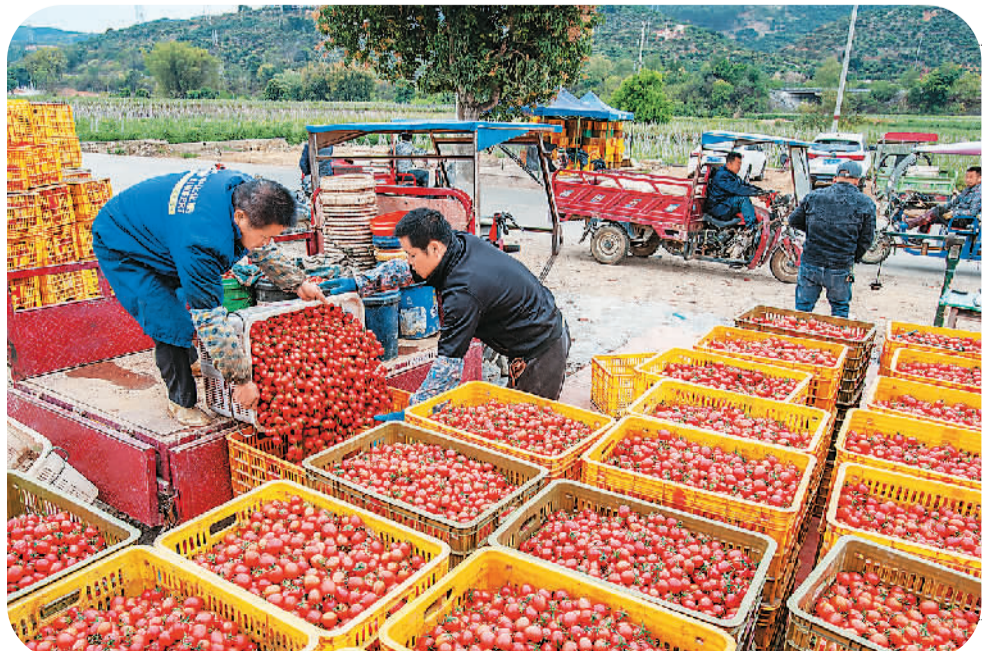
广西壮族自治区百色市田阳区是全国“南菜北运”的重要基地。初春时节，田阳区种植的23万多亩番茄陆续成熟，喜获丰收。图为2月27日，在田阳区田州镇东旺村东位屯番茄收购点，村民将小番茄装箱，准备外销。

波兰、乌克兰、德国和法国，就推动政治解决乌克兰危机开展第二轮穿梭外交。毛宁在回答记者相关提问时表示，乌克兰危机全面升级已满两年，战事仍在持续延宕，当前最紧迫的就是恢复和平。“早一天开启和谈，损失就会减少一分。”她表示，过去两年来，中方从未放弃劝和的努力，从未停下促谈的脚步。中方同包括俄罗斯、乌克兰在内各国深入沟通，为应对危机发挥建设性作用。中方专门发布《关于政治解决乌克兰危机的中国立场》文件，派特使穿梭斡旋。“中方没有袖手旁观，没有拱火浇油，更没有从中渔利。我们所做的一切，都通往一个目标，就是为止战凝聚共识，为和谈铺路搭桥。我们将继续发挥自身独特作用，开展穿梭外交，凝聚各方共识，为推动政治解决乌克兰危机贡献中国智慧。”毛宁说。