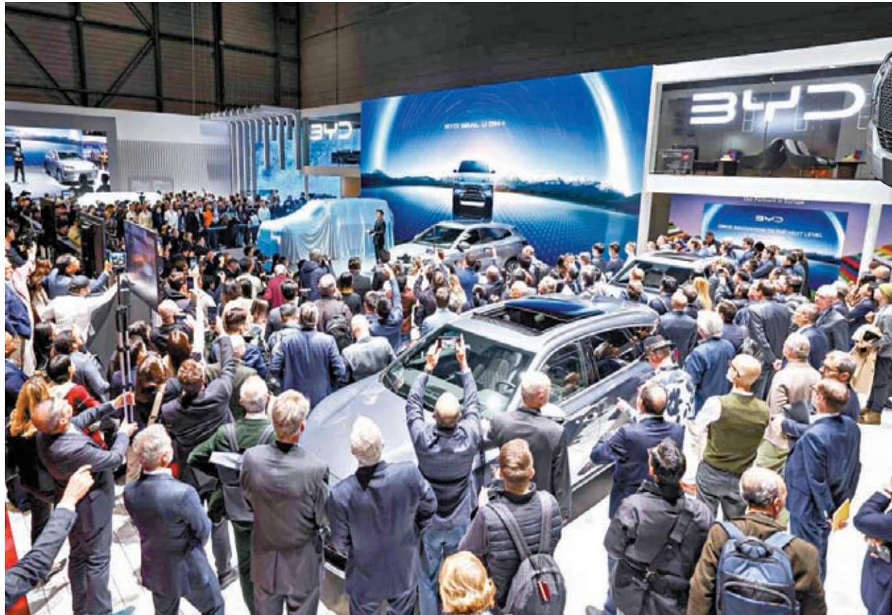
◆比亞迪攜8款新能源車型亮相日內瓦車展，成為全場焦點。 網上圖片

香港文匯報訊 全球知名5大車展之一的瑞士日內瓦車展，2月26日正式開幕。中國大型車企比亞迪攜同8款新能源車型亮相，成為全場焦點，進一步拓展其全球布局，加速中國新能源汽車全球化進程。彭博社分析指出，今次車展讓歐洲傳統車廠與聚焦電動車的中國車企同場較勁，隨着中國車企挾着低價車款壓境歐洲市場，迫使歐洲車廠降低成本，無論是歐洲車廠或是他們的供應商，勢必面臨艱難的一年。