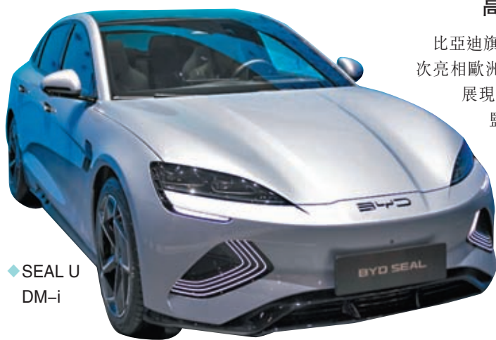
◆SEAL U DM-i

比亞迪旗下高端新能源車品牌「仰望」今次也首次亮相歐洲，首款旗艦SUV車型「仰望U8」在車展現場成為大家關注的焦點。比亞迪設計總監艾格在發布會上，對「仰望U8」的設計理念進行深入解讀，詮釋了比亞迪對未來出行方式的獨到見解與藝術美學追求，「『仰望』的設計美學喚起人們的情感，它所使用的新能源科技使生活更愜意。『仰望』是可持續奢華的體現。」此外，繼去年9月在德國慕尼黑車展首次亮相後，比亞迪旗下的騰勢品牌熱度不減，其首款豪華