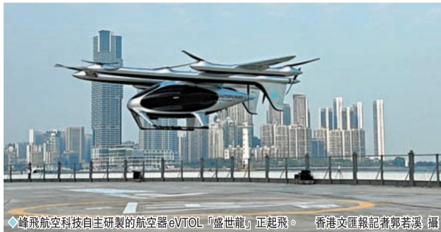
◆峰飛航空科技自主研製的航空器eVTOL「盛世龍」正起飛。