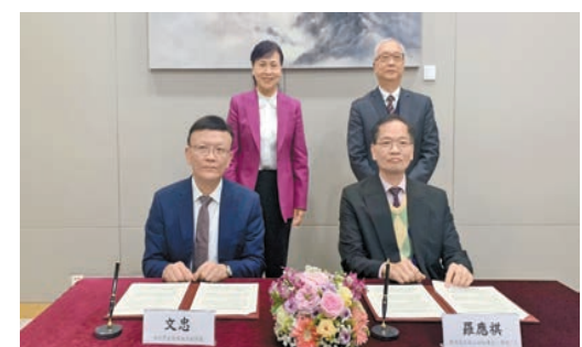
謝展寰(後排右)和張華(後排左)見證簽署《全面深化深港生態環境保護合作協議》。

【香港商報訊】記者馮仁樂報導：環境及生態局局長謝展寰率領的香港特區政府代表團，與深圳市人民政府副市長張華率領的深圳市政府代表團昨日在香港舉行港深環保合作專班會議。兩地政府總結自去年會議以來雙方的工作成果，並就未來一年的進一步合作以及相關工作交換意見。