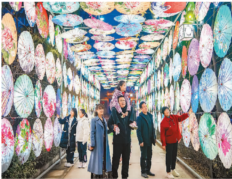
游客在运城市万荣县裴庄镇裴村裴家庄游玩。

看古城、逛大院，是山西旅游的一大特色。到山西过大年，平遥值得一去。跟很多古城里只能看到天南地北的