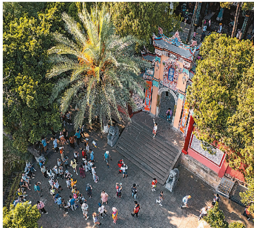
游客在重庆市奉节县白帝城景区游玩。

文化和旅游部有关负责人表示，下一步，要坚持保护优先、强化传承，文化引领、彰显特色，总体设计、统筹规划，积极稳妥、改革创新，因地制宜、分类指导，建好为本、用好为要6个原则，把长江国家文化公园建成传承中华文明的历史文化长廊、凝聚中国力量的共同精神家园、提升人民群众生活品质的文化和旅游体验空间、展示中国形象的靓丽名片。