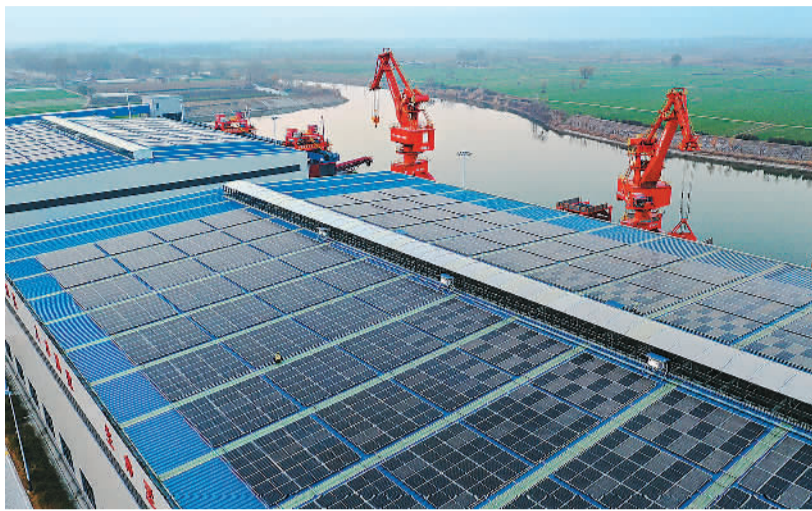
安徽省淮北市孙疃港1.54兆瓦分布式光伏建设项目，是安徽省首个零碳港口建设示范项目。项目以智慧用能平台为支撑，以绿电交易为补充，实现数据互联互通和资源精准调节，推动港口绿色低碳转型。

其次，降低行业减碳成本。通过碳排放配额交易，碳市场为企业履行减碳责任提供了更为灵活的选择，帮助行业实现了低成本的减碳。据测算，上述两个履约周期，全国电力行业总体减排成本降低了约350亿元。