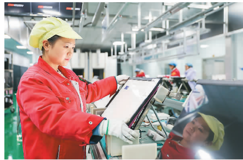
国内许多企业聚焦市场需求，加大研发投入，生产的智能显示终端、智能家居等产品畅销海内外。江西省瑞昌经开区智造小镇的江西瑞康技术有限公司是一家专注提供智慧教育系统及智能终端解决方案的高科技企业，产品远销日韩等国家和地区。图为2月26日，该公司车间内，工人正在生产线上测试产品。