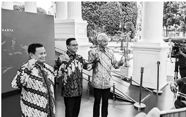
左起：普拉波沃、阿尼斯、甘贾尔。

【本报讯】外国媒体再次关注印度尼西亚总统选举，包括新加坡媒体亚洲新闻频道(CNA)。在其特别分析文章中，亚洲新闻提到了二号总统候选人普拉波沃。这篇文