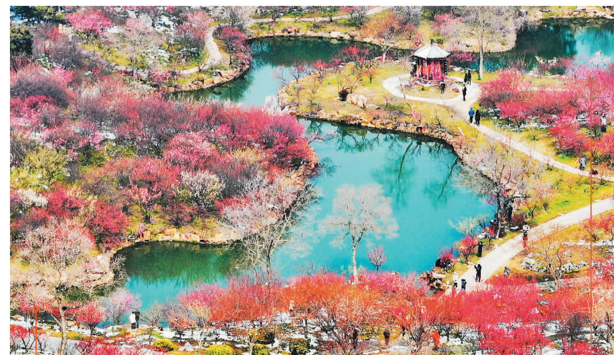
近日,江苏省扬州市瘦西湖风景区内梅花竞相绽放,春意盎然,吸引人们前来游览。图为游客在景区游玩。

舟”寓意载人月球探测承载中国人的航天梦,开启探索太空的新征程,也体现了与神舟、天舟飞船家族的体系传承;新一代载人飞船包括登月版和后续执行空间站任务的近地版两个型号,其中,登月版采用“梦舟Y”(飞船名称+“月”字音韵的大写首字母)。“揽月”取自毛泽东同志诗词“可上九天揽月”,彰显中国人探索宇宙、登陆月球的豪迈与自信。此前,新一代载人运载火箭已被命名为“长征十号”。