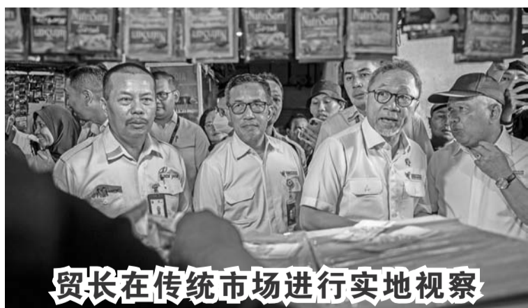
贸长在传统市场进行实地视察

2月26日，贸易部长祖基菲(Zulkifli Hasan/右二)到雅加达Klender传统市场进行实地视察，想确保在临近斋戒月和解禁节期间，基本日用品的供应充足，价格也显示稳定。