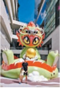
伯父與孫係過農曆年於曼谷精靈龍前留影。

這一次到美國探望家人，適逢是農曆新年，所以有些親朋戚友也可以放假幾天，當然不是法定假期。但美國原來給所有學生在農曆年初一可以放假，即是無論你是中國人也好還是外國人也好，這一天都是假期。但打工仔就要自行決定是否利用自己的假期在這幾天慶祝一下。