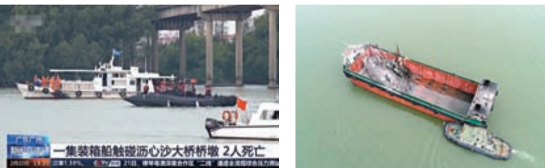
◆2月22日，一艘集裝箱船撞斷瀝心沙大橋橋墩，致瀝心沙大橋橋面斷裂。央視新聞截圖 ◆多支隊伍正在有序開展搜救工作。央視新聞截圖 ◆涉事船隻被拖走，船身上有掉落的車輛。新華社