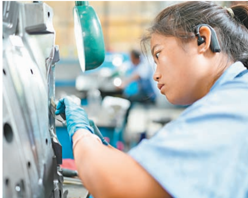
◆中國司法部、國家發展改革委、全國人大常委會法工委21日共同組織召開民營經濟促進法立法工作座談會。圖為去年在台州市黃岩區國家級專精特新「小巨人」企業浙江賽豪實業有限公司，工作人員對模具進行鏡面拋光。資料圖片