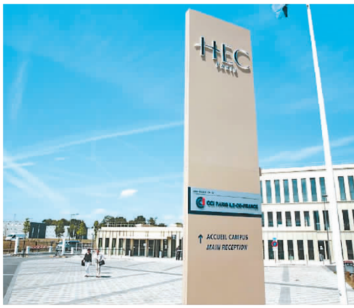
法国巴黎高等商学院一角。

如果不会法语，是否还可以去法国留学？对此，启德教育相关负责人表示，法国高等教育的授课语言一般有纯法语授课、纯英语授课、英法双语授课三种情况。据官方统计，近十年英语授课课程的数量增长迅猛，大多数院校的要求是英语B2（相当于雅思5.5-6.5）以上。