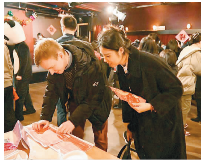
中国学生和荷兰学生一起参加游园会活动。