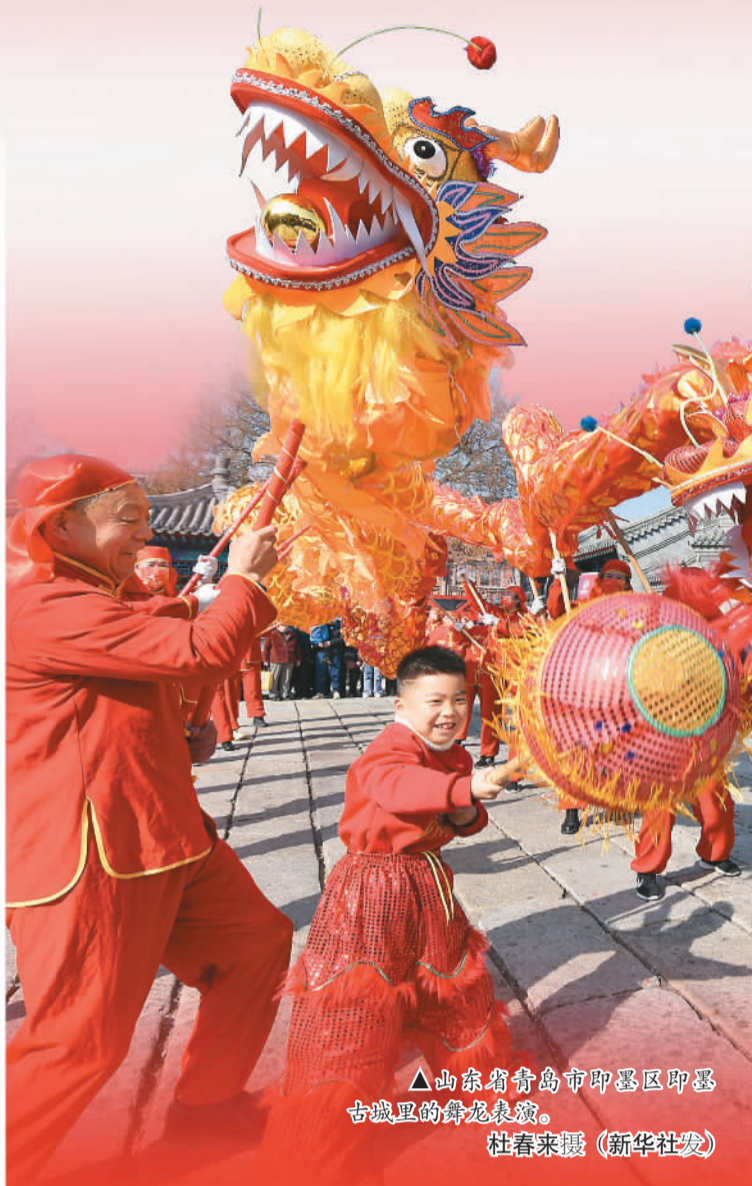
△山东省青岛市即墨区即墨古城里的舞龙表演。