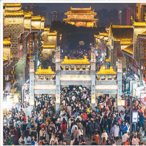
▶市民游客在湖北省襄阳市古城北街游玩。