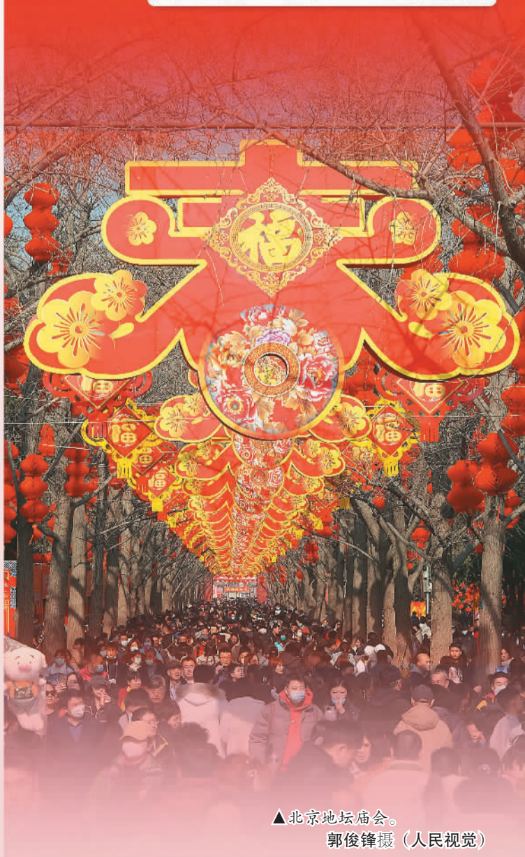
▲北京地坛庙会。