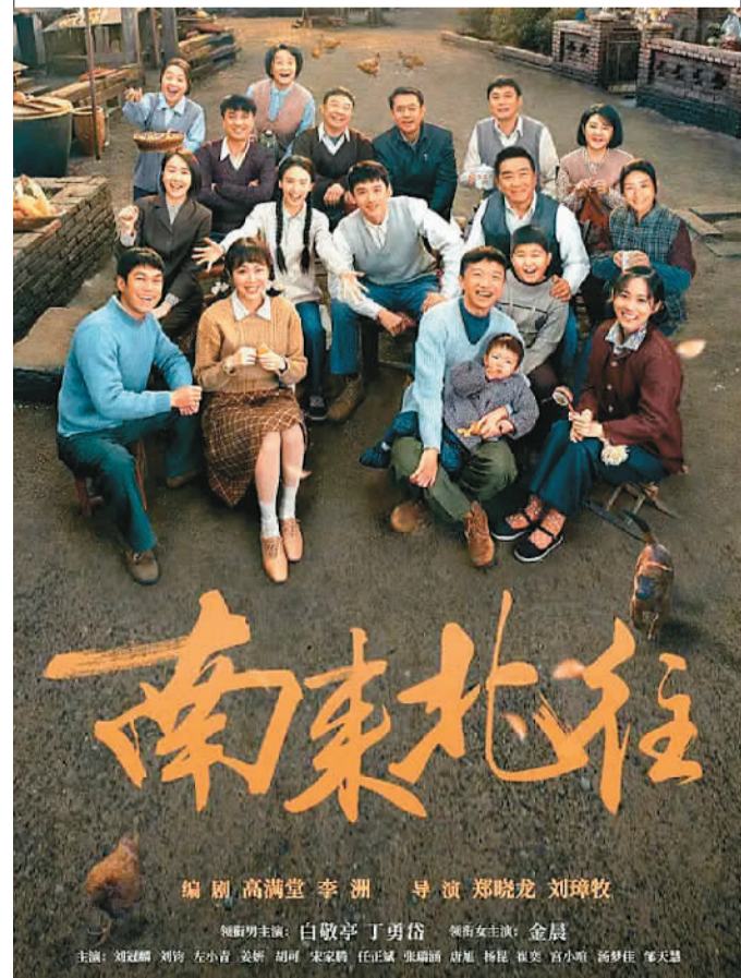
电视剧《南来北往》海报。

以普通人喜怒哀乐、苦辣酸甜为表现对象的影视剧作品，无论是年代追忆还是当代书写，如记录“光字片”半个世纪平民生活史的《人世间》，缀连现实生活中无数鸡毛蒜皮小事的《警察荣誉》等，皆因为如实地、真切地反映了不同时代下普通人的心声，才具有了超越时空的精神力量，成为精品。《南来北往》以深情目光回望大时代中的小人物、黑土地上的众生相，将个体、地域和社会紧紧绑在“时代”这趟列车上，在汽笛的轰鸣声中驶向未来，共鸣当下。