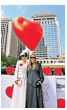
劉嘉玲盛裝出席剪綵儀式，與企劃人Anya Hindmarch合照。

Hindmarch，她的目的正正是：「純粹想透過Chubby Hearts傳播愛，想為大家帶來笑容。」所以開幕選在2月14日西方情人節，閉幕在2月24日元宵佳節。 項目先是在2018年於倫敦舉行，本次首度衝出英國，到其城市展出，而且足足比倫敦版大4倍，令香港國際形像更有厚度。除了有巨型紅心在中環助陣，展期間亦都有尺寸稍細的紅心在港九新界多個地標和旅遊景點「快閃」現身，包括旺角花墟、林村許願廣場，以及堅尼地城卑卑路街海濱等，每個地點快閃一日，每天早上香港設計中心會在網站公布詳情及在社交媒體公布當日地點。 香港政府用700多萬元資助這個項目，即每個香港人僅花1元就顯示了香港的國際化、多樣化、廣度和深度，物超所值。