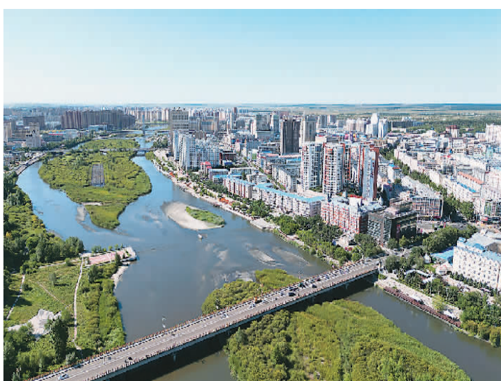
▲海拉尔区城市景观。

俯瞰茫茫林海，倾听阵阵松涛。海拉尔的树木并不多，却拥有一座国家森林公园。公园位于当地的西山上，是中国唯一以樟子松为主体的国家级森林公园。资料显示，该公园分为南园、北园、西园和后备资源区，统称为三园一区。冒着淅沥的小雨，记者在其南园看到树王、守望松、中弹树、甘泉松、连理松等树木，园里树木