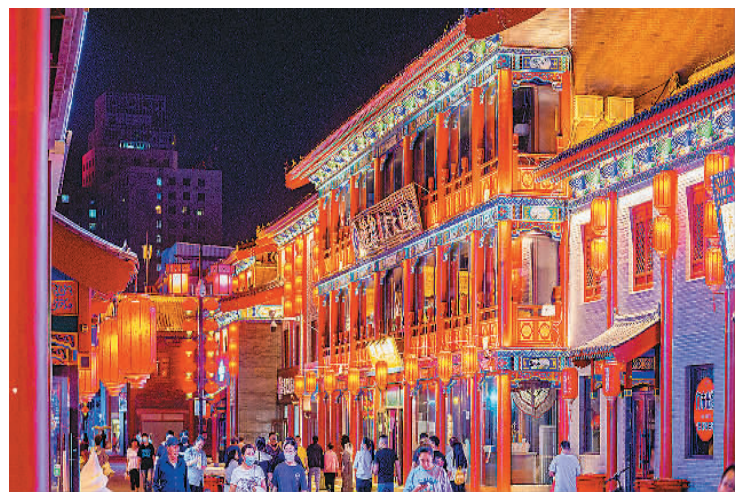
呼伦贝尔古城夜景。