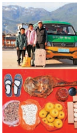
雲南省大理白族自治州文