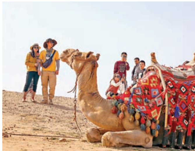
中國遊客參觀埃及吉薩金字塔景區。