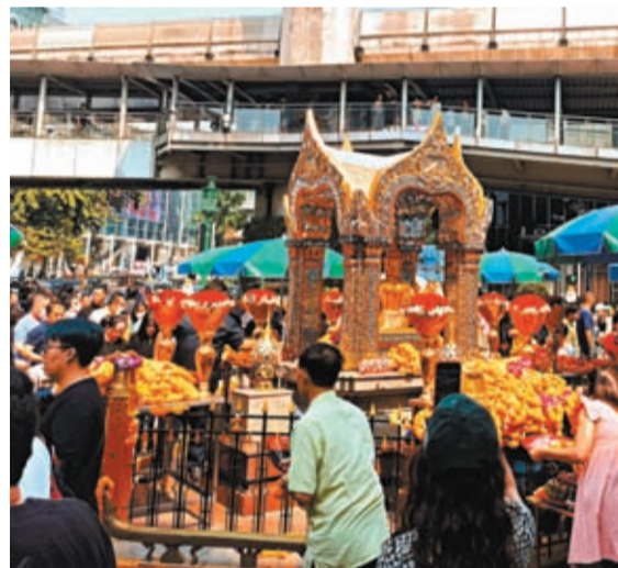
中國遊客在泰國曼谷紅網景點四面佛打卡。