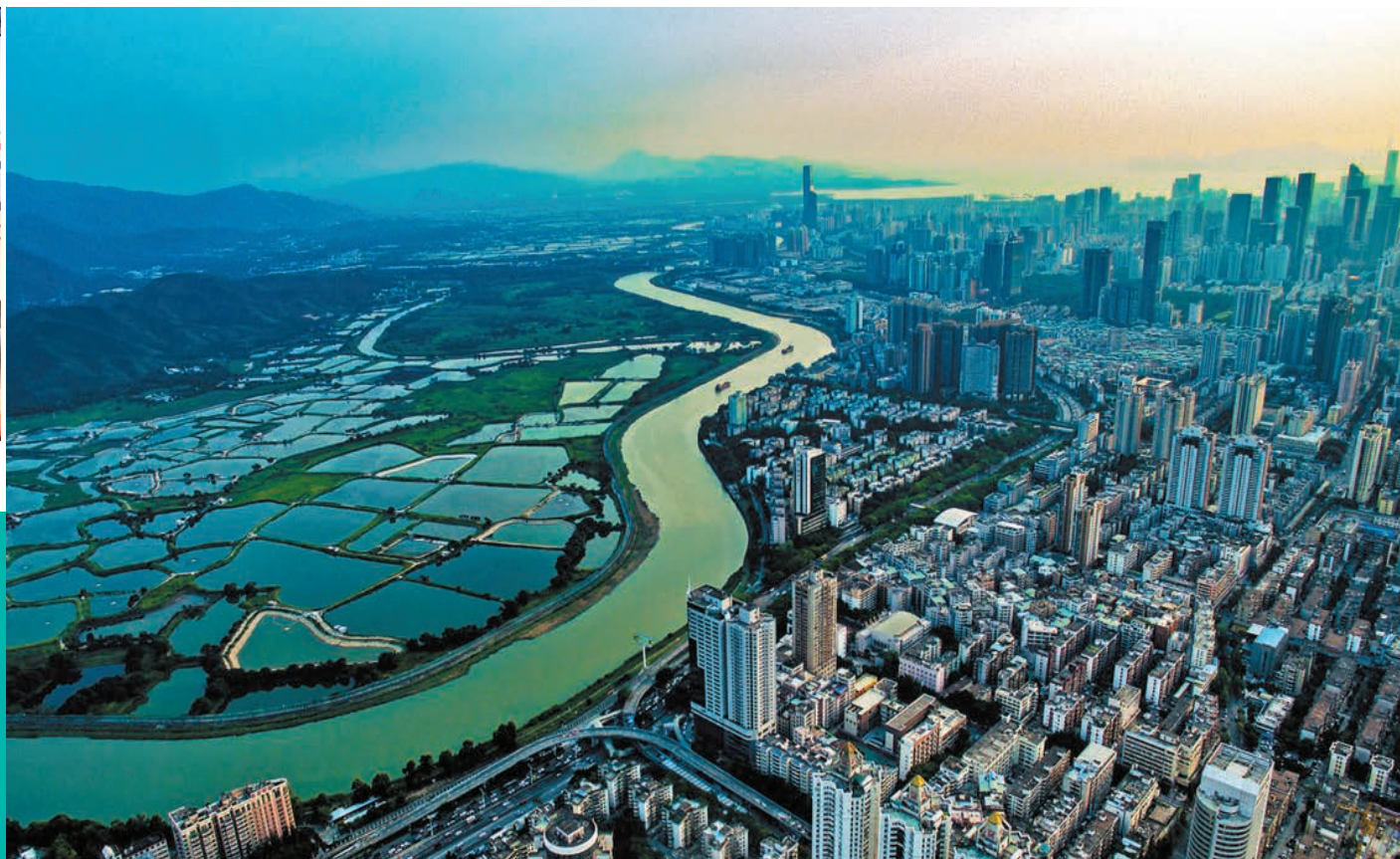
作為大灣區內高度開放和國際化的城市，香港在大灣區建設中扮演了極其重要的角色。圖為河套港深創新及科技園一帶。

從基礎設施「硬聯通」，到規則機制「軟聯通」，再到大灣區居民的「心聯通」，5年前繪就的粵港澳大灣區發展藍圖正一步步地變為現實。《粵港澳大灣區發展規劃綱要》公布5年來，大灣區在基礎設施建設、金融市場互聯互通、創新科技發展等方面取得了顯著成果。受訪專家認為，作為大灣區內高度開放和國際化的城市，香港在大灣區建設中扮演了極其重要的角色，既是參與者、貢獻者，亦是受益者，未來大灣區建設仍將繼續為香港經濟社會發展提供源源不斷的動力。