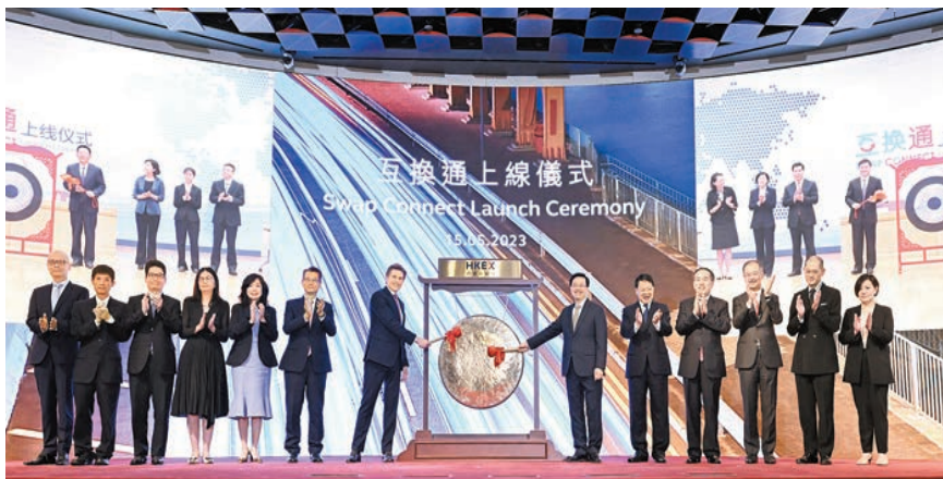
2023年5月15日，「北向互換通」正式啟動。資料圖片