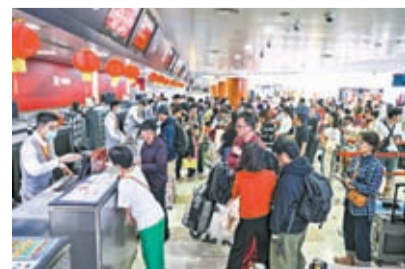
◆2月15日，旅客在海口美蘭國際機場T1航站樓排隊辦理值機手續。

續向上攀升，全國鐵路發送旅客1,515.9萬人次，再刷新高；2月16日，全國鐵路預計發送旅客1,530萬人次，計劃加開旅客列車1,813列。一些沒搶到火車票的旅客於是將目光轉向民航。按照預測，2024春運期間民航運輸旅客量將達8,000萬人次，日均200萬人次，有望創歷史新高。