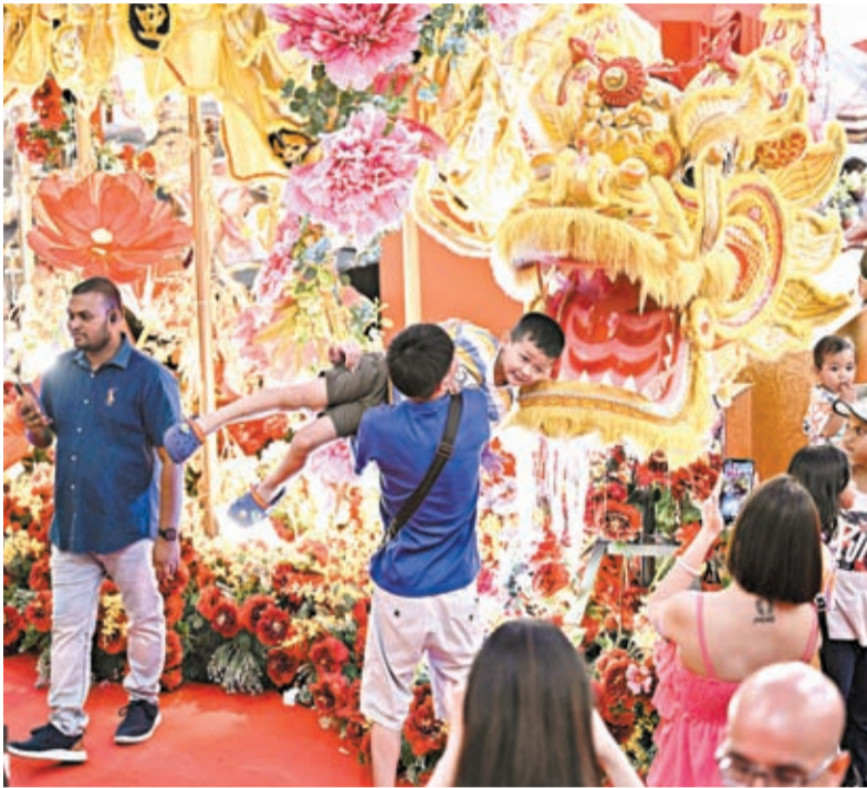
◆日前，在馬來西亞吉隆坡，市民與龍年布景互動。