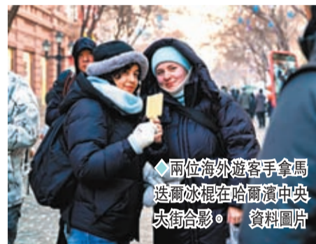
◆兩位海外遊客手拿馬迭爾冰棍在哈爾濱中央大街合影。資料圖片