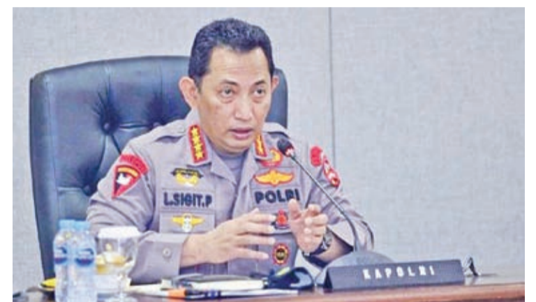
总警长里斯提约将军。

【本报讯】警方提醒是2024年大选后将出现抗议浪潮的可能性。2月14日，总警长里斯提约将军表示，抗议活动来自那些不接受2024年选举计票结果的政党。我们希望所有人都能使用正确的法律程序进行诉讼。我们有大选监督机构、普选委与宪法法院。我国军警将阻止那些在投票日期后试图走上街头的民众，这样做是为了预计2019年会发生类似事件。我们将以2019年的经验来预防2024年。总警长呼吁民众将抗议或涉嫌舞弊的案件提交法律诉讼。总警长最后表示，街头抗议会扰乱公共秩序，扰乱其他民众的利益，当然我们都能够为一切实能发生的情况做好准备。(亮剑)