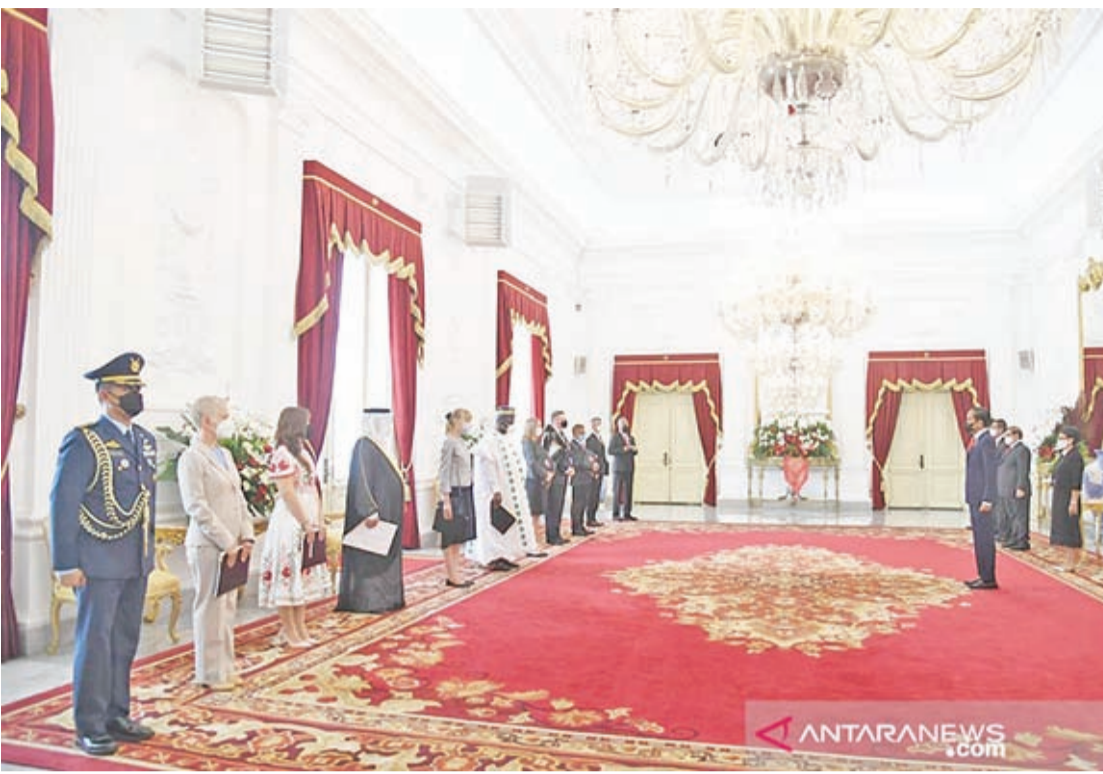
九名友好国家大使向佐科维总统递交国书。

【本报讯】2月15日，九名友好国家特命全权大使在雅加达独立宫向佐科维总统递交了国书。递交国书标志着正式任命驻印度尼西亚大使的开始。全权证书的颁发是通过在独立宫举行的一系列活动进行，现场还演奏每个国家的国歌。