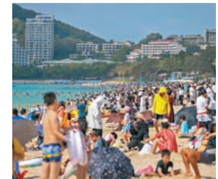
2月13日，眾多中外遊客在三亞大東海旅遊景區享受陽光沙灘，體驗不一樣的春節假期。

電體有廳行業管理和安全監管處處長周興華表示，建議遊客從海口乘機離島，航班相對比較多，價格相對比較便宜。同時遊客也可到新海港乘船離島，離島成本也將大幅下降。