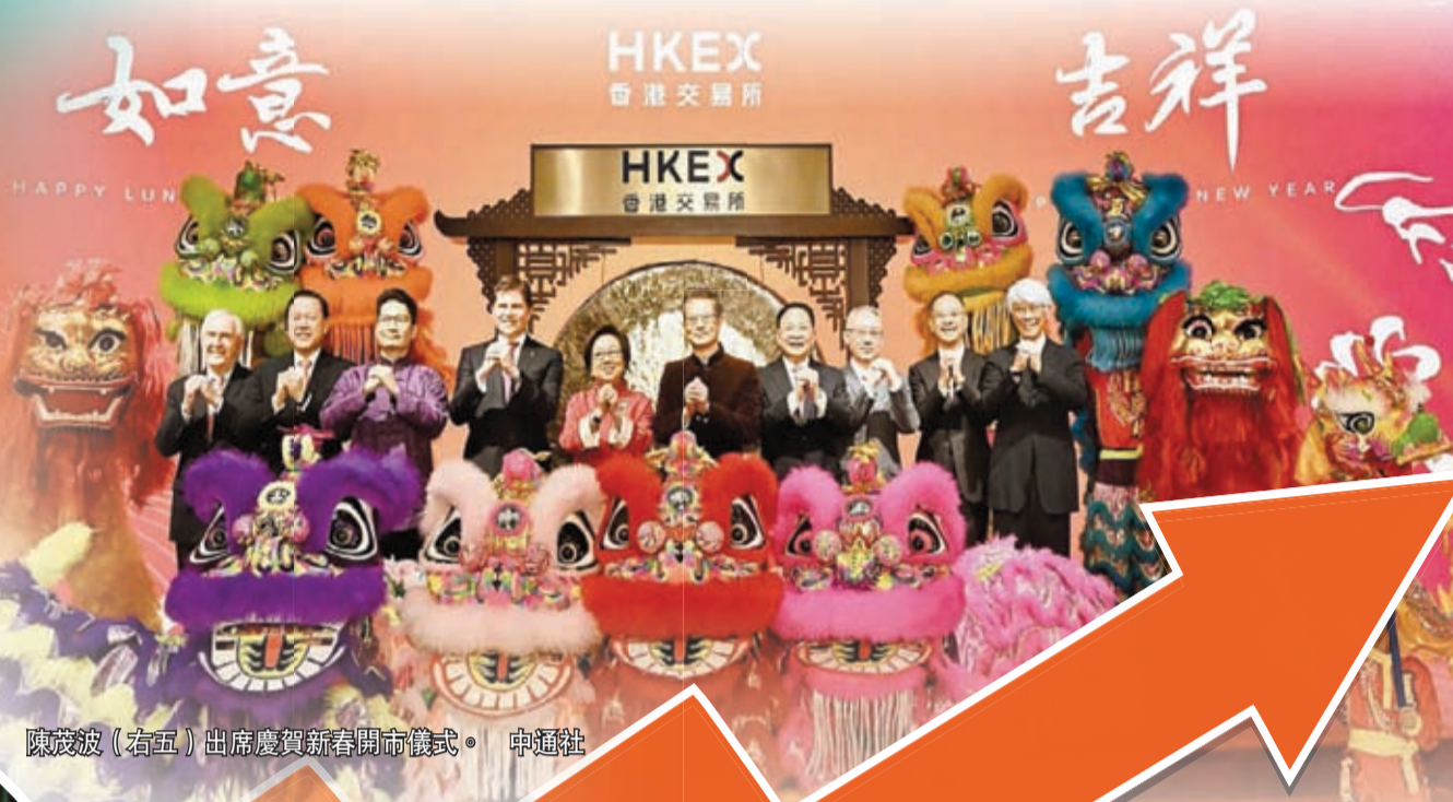
陳茂波(右五)出席慶祝新春開市儀式。

【香港商報訊】恒生指數連續5個龍年首個交易日錄紅盤高收。恒指昨日收報15879點，升132點或0.84%，成交額570.64億元。大型科網股盤中造好，美團（3690）新春外賣訂單錄得明顯增長，收市升5.65%，為表現最好藍籌。有評論認為，早前港股市場曾受內地平準基金等利好刺激，短期或出現技術性反彈；惟後市能否持續走強仍有待觀察。