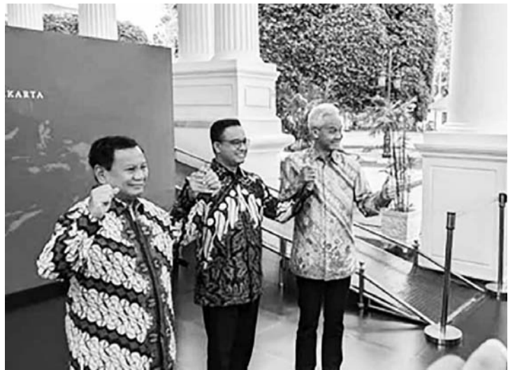
左起：普拉波沃、阿尼斯、甘贾尔。

【本报讯】外国媒体再次关注印度尼西亚总统选举，包括新加坡媒体亚洲新闻频道(CNA)。在其特别分析文章中，亚洲新闻提到了二号总统