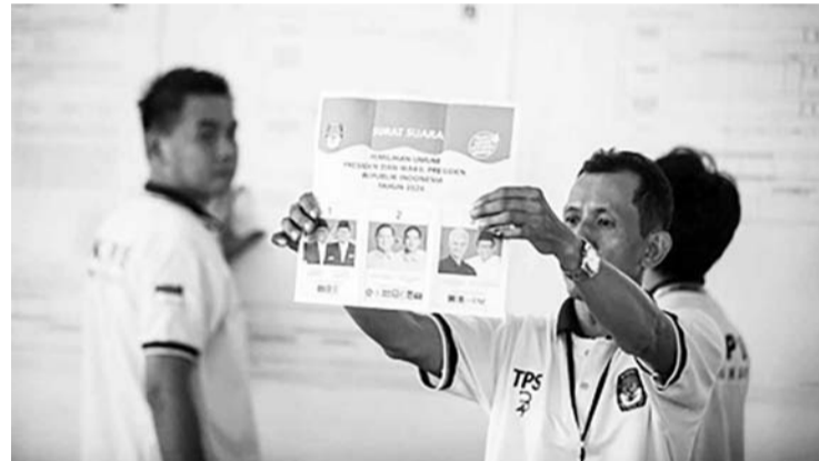
普选委称分层计票结果需时35天揭晓。

【本报讯】2月14日，普选委员会委员伊达姆·赫利克(Idham Holik)申明，官方计票数据仍将由普选委通过分层总结进行，从投票站、乡公所、区镇公所、市县政府、省级至中央。在投票的日期与之后，或2月15日之后，地方普选委将开始进行总结过程。