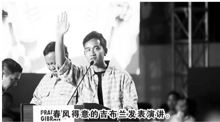
春风得意的吉布兰发表演讲。

【本报讯】2月14日晚上，在雅加达翁加诺主体体育馆举行的庆祝快速计票结果的演讲中，二号副总统候选人吉布兰声称，大约三个月前，我还是一个无名小卒。经常被揶揄感觉困惑、误称硫酸、害怕面对辩论。