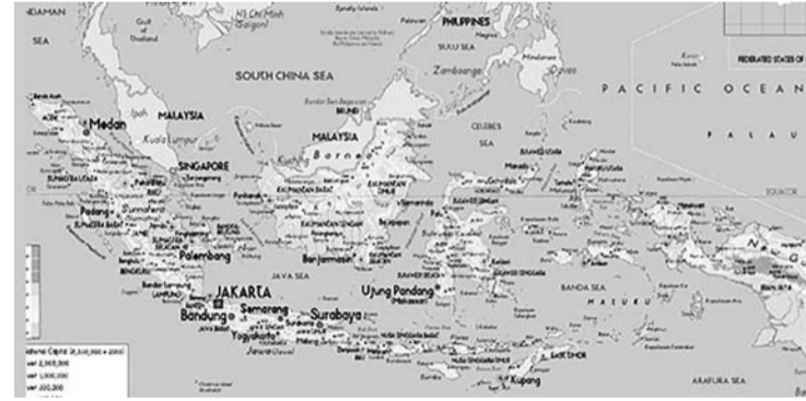
印尼成为全球单日投票量最大国家。

【本报讯】2月14日，印度尼西亚已经举办了一个为期五年的民主盛会，以选举总统和副总统以及立法委员。印度尼西亚公民于这一天在东南亚群岛上投票，选举取代佐科维总统领导这个世界第三大民主国家。近259,000名候选人在世界上最大的单日选举中争夺17,000个岛屿上的20,600个议会席位。但是，所有的注意力都集中在总统席位和佐科维雄心勃勃的议程的命运上。