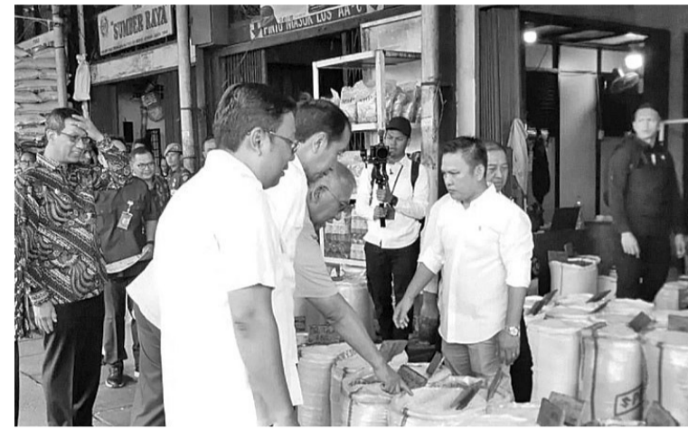
粮食援助能协助控制米价 2月15日,佐科维总统在视察市场时表示,政府提供的粮食援助,旨在协助控制大米价格。