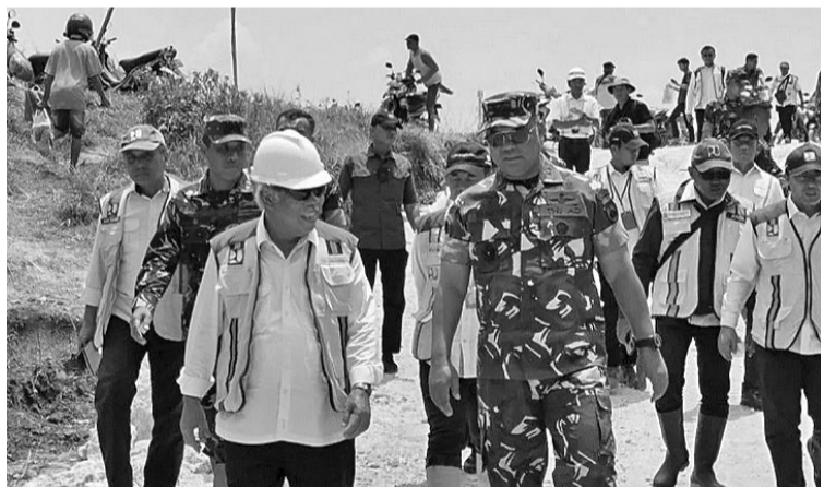
淡目县勿兰河流堤坝决口已完全修复 公共工程与民居部长巴苏基 (Basuki Hadimuljono) 于2月15日在淡目 (Demak) 县 Karanganyar 镇 Ketanjung 乡,由迪波尼果洛第4军区司令丹迪约 (Tandyo Budi Revita) 少将陪同视察已完全修复的河堤决口地点。

【本报讯】雅加达专区省粮食、海洋和农业保障局 (KPKP) 正在为2024年在44个行政区划推出平价市场计划,作为内政部先前指导的后续行动。