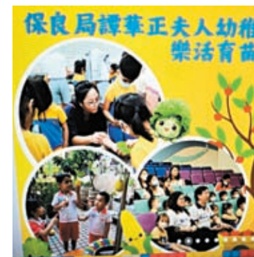
◆保良局譚華正夫人幼稚園的校園活動甚豐富。