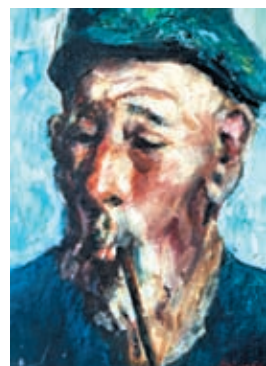
◆不應因為長者年紀大而放棄醫治。

我好友的母親住在加拿大，2年前以99歲高齡，醫院為她做了個大型的心臟手術，我心內讚嘆，行醫者沒有放棄拯救任何一位病人，這也是對長者病人的尊重。現在這位101歲的伯母，樂於享受健康的生活！