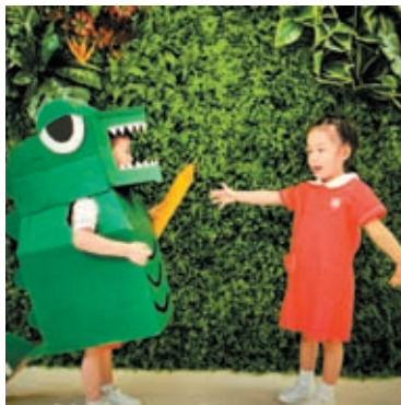
◆保良局譚華正夫人幼稚園的校園活動甚豐富。

臨行前，我把從四川成都帶回的熊貓盲盒贈送給了小升旗隊員們，在場的老師告訴孩子們這是熊貓，是我們的「國寶」。在我看來，這些陽光可愛、積極向上的小朋友也是我們的「國寶」，他們是建設美好香港的未來和希望。