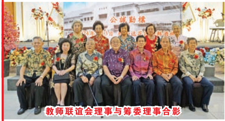
教师联谊会理事与筹委理事合影