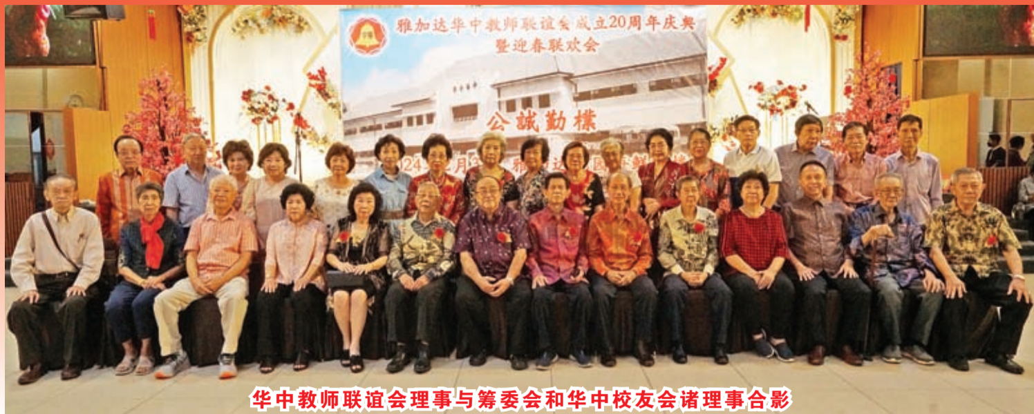
华中教师联谊会理事与筹委会和华中校友会诸理事合影