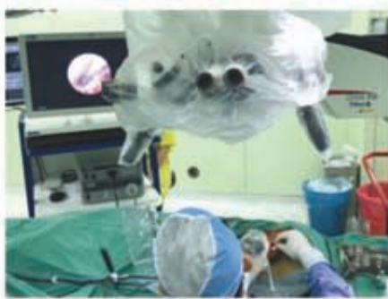
图一：双镜人工耳蜗手术，耳部小孔洞精准植入人工耳蜗电极。