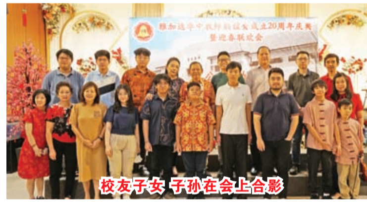
校友子女 子孙在会上合影