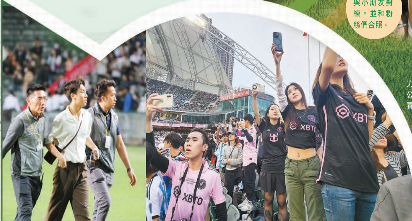
在練習賽場地不停的有粉絲衝到球場，最後被安保人員帶離現場。

主辦單位提醒，在官方票務合作平台Klook上發售的賽事門票上，均附有一個獨特、而只能被掃描一次的二維碼作進場之用，進場人士必須持個人門票掃描二維碼進場，每張門票二維碼只能被掃描一次，也不能憑票再次掃描進場，持票人士應提早抵達香港大球場作檢查門票及安全檢查，同時建議球迷使用個人智能手機存取門票二維碼，妥善保管。