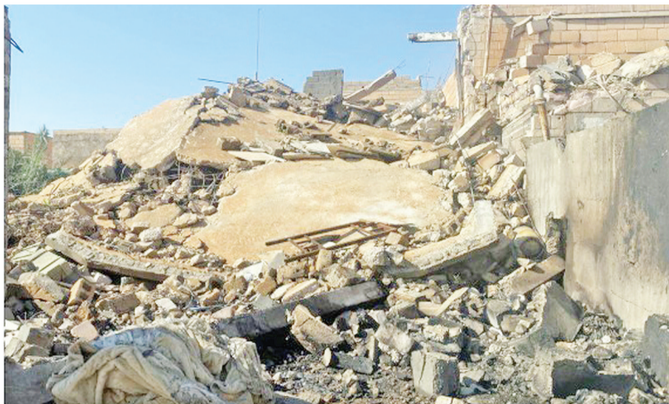
这是2月3日在伊拉克安巴尔省拍摄的遭美军袭击损毁的房屋。

尚不清楚空袭造成的全部伤亡情况。叙军方在一份声明中说,空袭造成平民和士兵伤亡,一些公共建筑和私人财产受损。总部位于英国的“叙利亚人权观察组织”的数据显示,空袭已造成叙境内至少23名武装人员丧生。伊拉克总理办公室说,