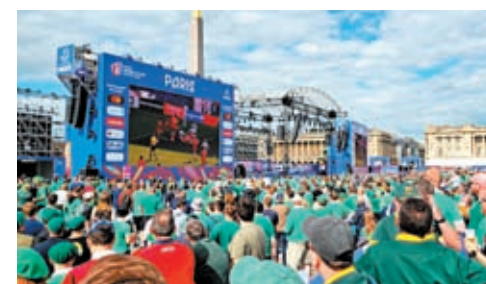
◆欖球世界盃合共吸引60萬名海外遊客赴法。