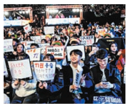
◆賽事累計觀賽人數達4億人。網上圖片

式項目，電競產業作為體育產業吸引力日增，能夠帶來更多經濟收益，「定期舉辦電競線下賽事、為相關產業提供支持將非常重要。」