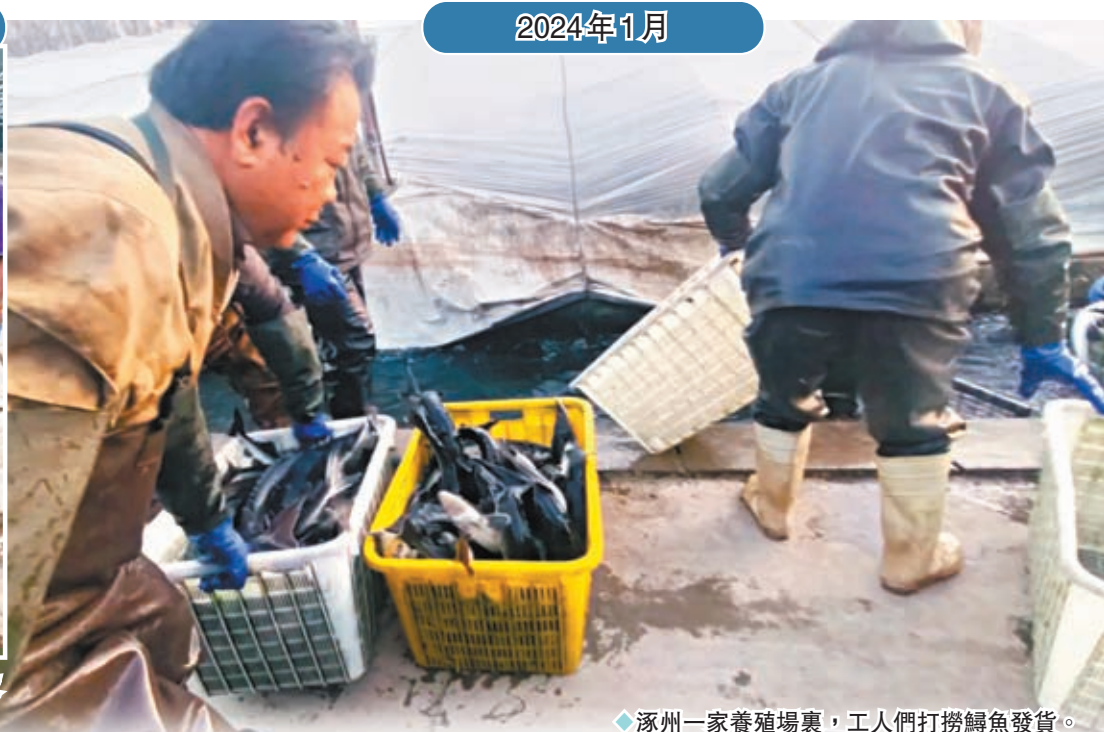
涿州一家養殖場裏，工人們打撈鱈魚發貨。