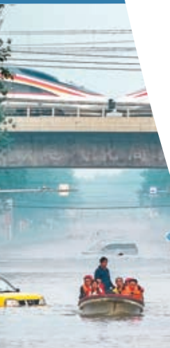
2023年8月2日，受洪災影響的涿州市民乘船隻轉移。