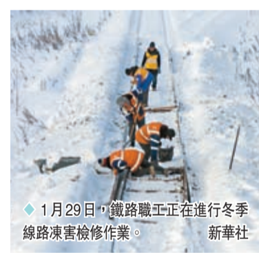
1月29日，鐵路職工正在進行冬季線路凍害檢修作業。

度加重，不利於油菜、經濟林果等恢復生長。1月29日，農業農村部下發緊急通知，要求各級農業農村部門強化風險意識和底線思維，持續繃緊防災減災這根弦，努力把災害損失降到最低，保障農業生產安全和蔬菜等「菜籃子」產品穩定供應。具體有三個工作方向：一是加強監測預警，落實防禦措施；二是精準指導服務，搞好生產恢復；三是抓好「菜籃子」產品生產，保障市場供應。