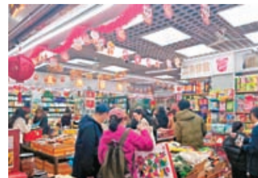
深圳市民在華強北的紫荊城港貨中心選購港版年貨。

香港文匯報訊（記者 李昌鴻 深圳報道）隨着2024年春節即將到來，深圳華強北紫荊城港貨中心迎來大量前來採購年貨的顧客。有質量保證的港貨始終深受內地消費者歡迎，何況售價與香港相近，不少顧客便在深圳就近買年貨。近日香港文匯報記者看到，有深圳市民少則花費數百元（人民幣，下同），多則上千元購買香港進口的年貨，不少人除了自用還選擇郵寄回老家送親戚。有商家表示，港版費利羅巧克力、藍罐曲奇餅、堅果禮盒等十分搶手，部分禮盒已斷貨。