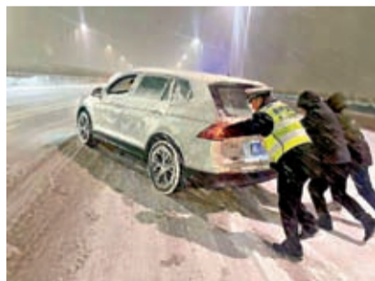
河南近日遭受雨雪冰凍天氣侵襲，交警在風雪中幫助私家車主推車。資料圖片

中央氣象台有關專家表示，本次天氣過程河北南部、河南、山東的降雪量都比較大，但其持續時間、低溫強度、冰凍範圍尚不及2008年