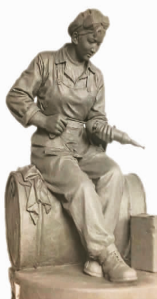
女拖拉机手（雕塑） 宋兴华