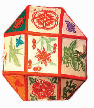
花灯 山东工艺美术学院博物馆藏

正如春节的传统里，从小年起，人们就开始“忙年”的种种准备，洒扫除尘，采办年货，发面蒸馍，张贴年画、春联、“福”字、窗花等。天津俗话说，闺女要花，小子要炮，老人要顶毡帽。春节是喜庆，是更新，是对美的追求。到农历新年来临，人们摆“清供”，逛庙会，行花街，耍社火，舞狮舞龙，观灯彩，在生动鲜明的形态、沉浸式体验中，表达情感，寄托愿望，感受喜庆欢愉，抒发对美好生活的向往。从这个意义上看，春节既是民俗的，也是艺术的、审美的，并且春节的艺术，是民间、大众、民族集体关于美的创造与体验，它是所有人亲身参与的过程。