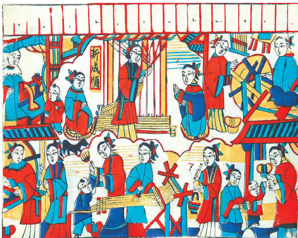
山东潍坊杨家埠年画《女十忙》