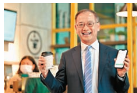
◆香港金管局總裁余偉文在曼谷一家咖啡廳使用了轉數快×PromptPay跨境二維碼支付互聯。

金管局代表團與泰國央行於1月29日進行雙邊會議，重點聚焦跨境貿易中本地貨幣的使用、金融數碼化和金融科技，以及綠色和可持續金融，雙方亦同意加強合作及深化兩地金融聯通的未來舉措。由香港銀行公會組織的海外代表團亦於同日到訪泰國，並舉辦半天的泰國商務論壇，吸引近130位代表及港、泰兩地的銀行界領袖參與。