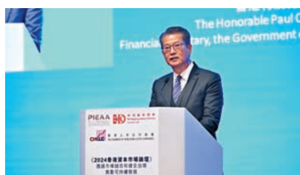
◆陳茂波指，香港要加深與內地金融市場互聯互通，貢獻國家建設金融強國。

他坦言，地緣政治難免影響了部分來自歐美的資金流向，但同樣因為全球政治格局的形勢，中東的資金，從主權基金到家族辦公室，也在積極尋求歐美以外的投資