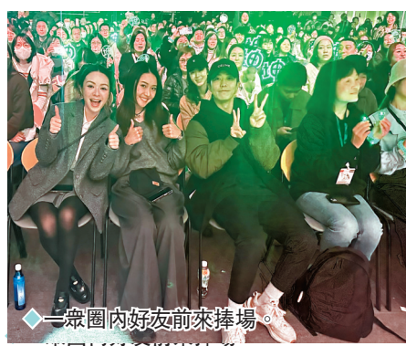
◆眾星圍住好友前來捧場。