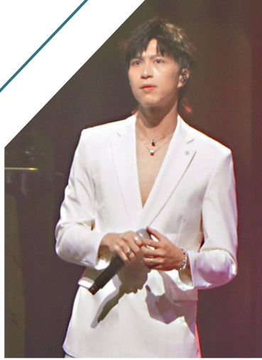
◆坤哥脫下眼鏡化身白馬王子。