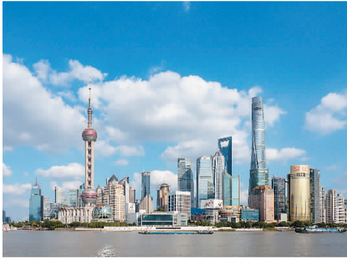
在上海黄浦区外滩眺望浦东新区，陆家嘴城市天际线错落有致，风景优美。

促进跨境贸易创新发展——上海市及浦东新区加强贸易促进与国际合作，高质量实施已生效的自由贸易协定，提升口岸通关、货物流转、跨境结算、商务人员往来等便利度，优化外贸发展环境。上海“丝路电商”合作先行区通过19项先行先试举措探索体制机制创新，在浦东相关海关特