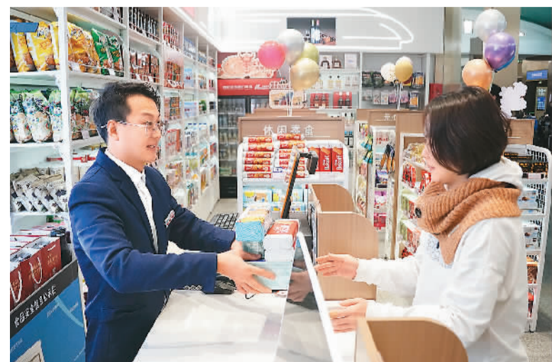
近日，中欧班列进口商品保税店在北京火车站落户，店内销售来自中欧班列沿线多个国家的食品、日用品、化妆品等商品。图为1月26日，旅客在北京站内的中欧班列进口商品保税店内购物。

中国华融成立于1999年，与中国东方、中国长城资产、中国信达并称四大资产管理公司，这四家公司旨在为应对亚洲金融危机、化解金融风险、促进国有银行改革和国有企业改革脱困而成立。