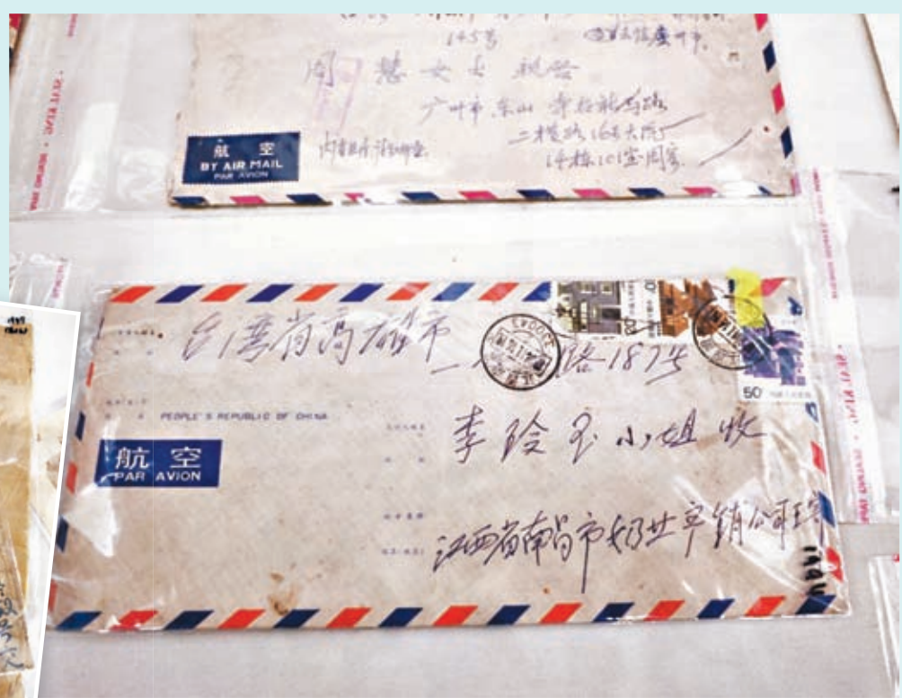
現場展示的部分書信。