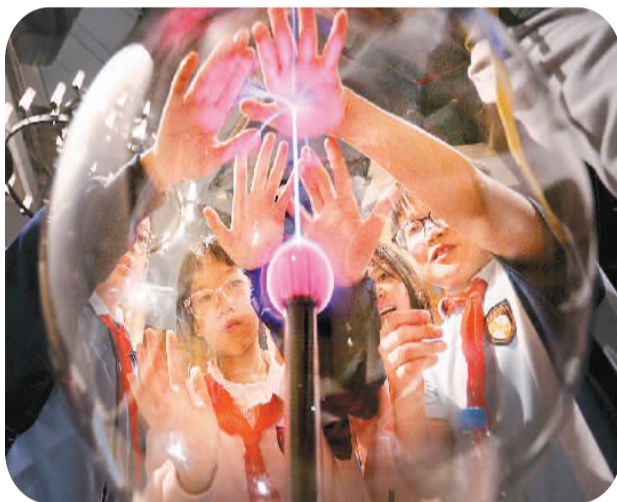
学生们在广东科学中心观察和体验“辉光球”放电现象。

记者在采访中了解到，新加坡是备受关注的出境研学游热门目的地，“新加坡游学之旅”“新加坡亲子微游学”等产品预订火热。“新加坡亲子微游学”专为6至15岁中小学生家庭设计，以科学实验、技术编程、工程结构、艺术探索、数学逻辑等课程为特色。在旅程中，家庭成员不仅能一同领略新加坡的历史人文和美食风情，还可以通过南洋理工大学《智能机器人与3D打印技术》、科学馆《飞行科学与飞机设计》、红树林《科技与环保》、日间动物园《动物健康与保育》以及新加坡国家美术馆和乌节路图书馆的《艺术探索与结构美学》等一系列课程，让孩子们在轻松愉快的学习氛围中开拓视野，在实践中感受知识的无穷魅力。