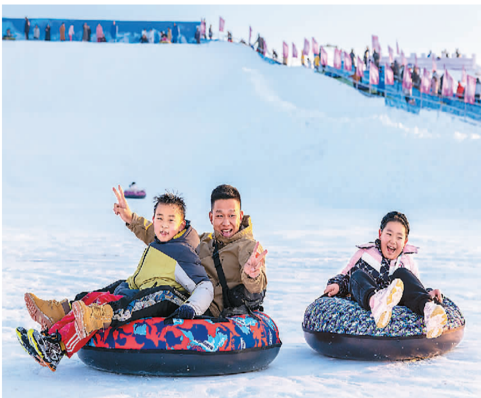
亲子游客在第三届呼和浩特欢乐冰雪节活动现场体验雪圈。