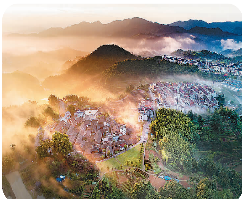
磐安县乌石村风光。

“古茶场越好，游客就越多，村民的发展机会就越好。”磐安县相关负责人表示，古茶场展陈提升和周边配套改造，解决了旅游发展的痛点难点，回应了村民们的诉求，“古茶场+古村”的模式将带动周边村庄发展。