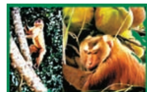
◆面目鮮明的美猴工。

本來大猴離開森林，逃過與獅狼虎豹搶地覓食的煩惱，生活本來應該安定得多，看牠皮色柔潤，便知森林獵食營養始終好不過天天辛苦賺來幾條胡蘿蔔，可惜命運總不幸落在良心其黑如墨的椰商手裏。