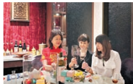
◆50年後重逢的緣分，將成就彼此的生命。

我們分享50年來的人生經歷，發現所有的在意，其實都是在當下而已；當星移物換，一切的一切都不是那麼重要，最終生命仍是孤獨的，各走各自的人生路，生命本是一個人來，一個人去，生命的豐盛之處在於經歷過程，並與自己在平行或交叉路上所遇到的人和事。