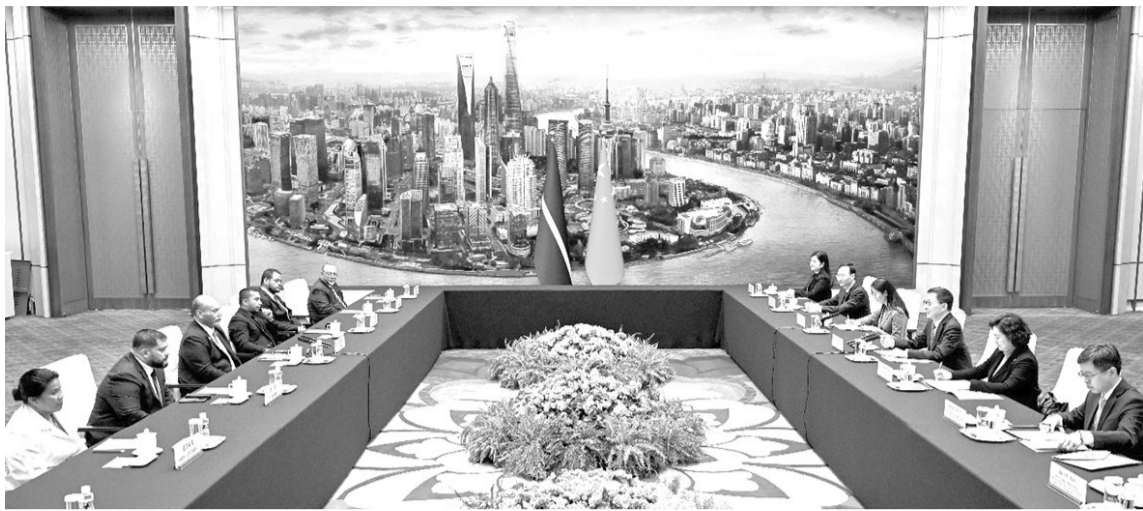
1月25日,国家副主席韩正在北京人民大会堂会见瑙鲁外长安格明。

新华社北京1月25日电 中国国家副主席韩正25日在人民大会堂会见瑙鲁外长安格明。