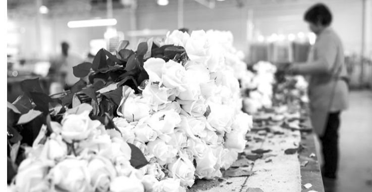
1月24日,莒县曲坊现代农业产业园工人们正在分拣、打包鲜切花。春节临近,山东省日照市莒县曲坊现代农业产业园高原红、爱莎等27个品种的玫瑰花集中上市,日销量在10万枝左右,供应北京、上海、广州等城市。