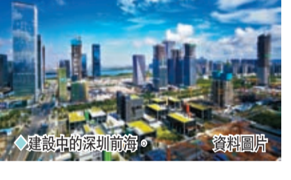
◆建設中的深圳前海。