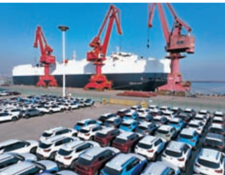
◆在江蘇連雲港港東方港務分公司碼頭，滾裝輪在裝載出口汽車。

香港文匯報訊 據新華網報道，近日，北京、河北、重慶等十餘省份陸續進入省級兩會時間。在政府工作報告中，多地公布了2023年度經濟數據。根據公布的數據，2023年多地GDP增速在4%至9%之間，其中，西藏預計地區生產總值超2,300億元人民幣、增長9%左右。在政府工作報告中，多地還公布2024年的預期目標，從目前公布數據來看，最高的是西藏，預期目標是增長8%左右。