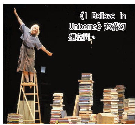
《I Believe in Unicorns》充滿幻想空間。

《The Very Hungry Caterpillar Show》（適合2歲或以上兒童觀看）改編自作家兼插畫家埃里克·卡爾創作的書籍，該書曾經讓世世代代的讀者陶醉其中，全球銷量超過4300萬冊。埃里克的作品以標誌性的彩色手工紙拼貼插圖和簡單的故事迷住讀者，讓孩子認識一個更廣闊、更明亮的世界。兒童英語話劇節將這套作品搬上舞台，演員將與75個可愛的木偶一同演出，讓大小觀眾跟隨飢餓的毛毛蟲四出覓食，並見證毛蟲如何蛻變成美麗的蝴蝶。