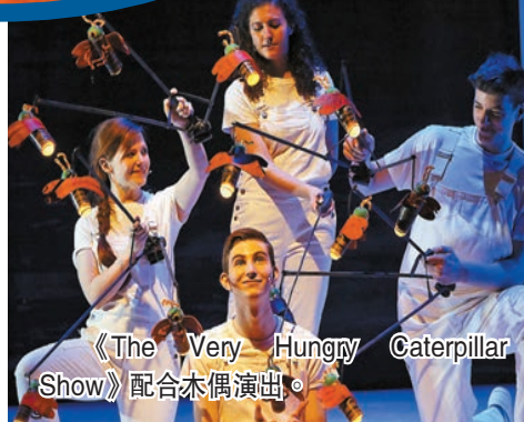
《The Very Hungry Caterpillar Show》配合木偶演出。