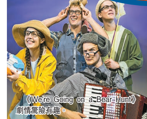
《We're Going on a Bear Hunt》劇情驚險有趣。