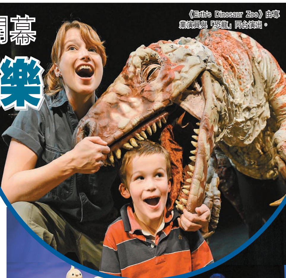
《Erth's Dinosaur Zoo》由專業演員與「恐龍」同台演出。