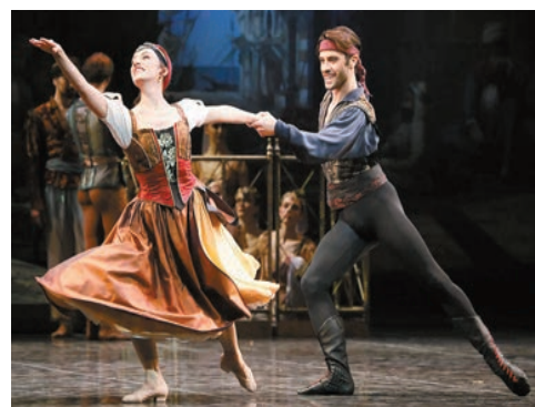
《海盜》的異國情調、刺激情節及高難度動作，使其成為百年經典。