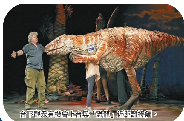
台下觀眾有機會上台與「恐龍」近距離接觸。

《Erth's Dinosaur Zoo》曾經在2016年來港上演，當時大受歡迎。節目由現場觀眾與台上「恐龍」互動，在主持引領下，台下小朋友可以在互動環節踏上舞台，親手餵飼及觸摸栩栩如生的「恐龍」。「恐龍」像真度極高，令現場驚喜連連。劇場會出現可愛的恐龍BB，也有曾經統治地球的大型草食和肉食恐龍，還包括昆蟲與哺乳類動物等。台上主持會引領台下大人小朋友進入一個恐龍樂園，過程緊張刺激。通過近距離與遠古時代的生物接觸，小朋友可以增進古生物學及環保知識，兼體驗成為表演者一分子的樂趣。