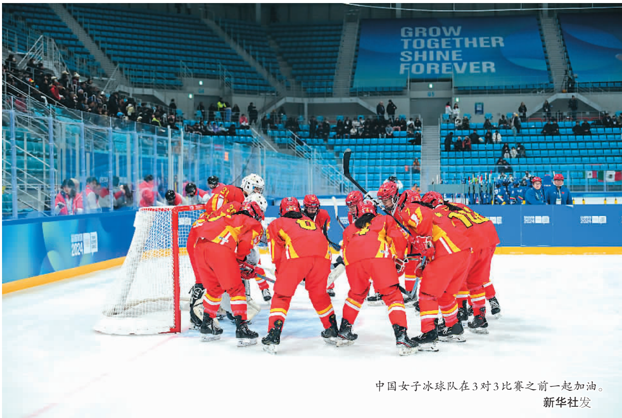
中国女子冰球队在3对3比赛之前一起加油。