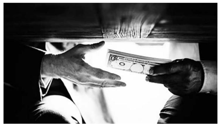
美国揭露印尼官员收受外国巨头贿赂的证据。

【本报讯】德国软件公司SAP被要求支付2.2亿美元或相当于3.4万亿美元的罚款，制裁行动是基于美国司法部与美国证券交易委员会的调查结果。SAP被发现违反了《反海外腐败法》。美国监管机构发现SAP非法向南非和印度尼西亚的政府官员行贿。3.4万亿美元的罚款将用于完成对正在进行的贿赂案的调查。