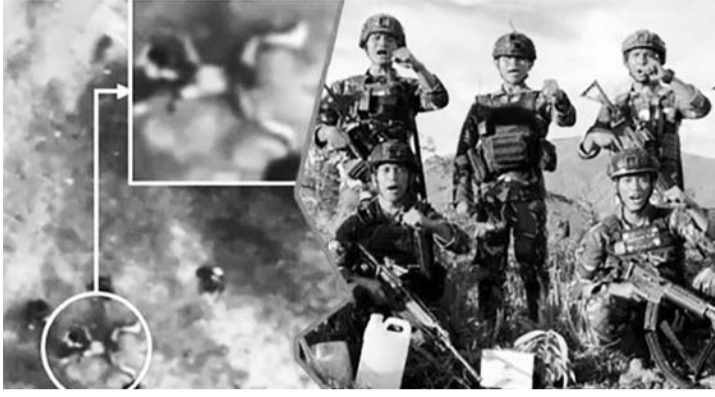
军警联队与巴布亚武装犯罪团伙激战三天。

【本报讯】在巴布亚省英丹查雅县( Intan Jaya )，军警联合部队与巴布亚武装犯罪团伙交火三天，五名匪首被击毙。这些分离主义团体的领导人是在与军警联合部队交火后，被击毙死亡。2024年Cartenz和平队行动主任怀沙尔上校(Faizal Ramadhani)声称，被击毙的五名武装犯罪