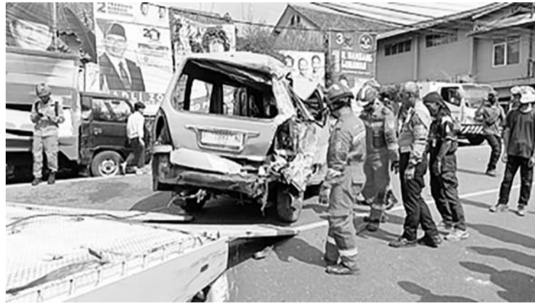
茂物县本哲区九辆车连环车祸导致17人受伤。

芝沙卢瓦警区警长艾迪少校(Eddy)表示，交通事故始于一辆运输瓶装矿泉水的箱式卡车，该卡车从本哲地区开往卡托(Gadog)时忽然失控，而刹车又失灵。在下坡路况下左转弯时，卡车撞上了一辆摩托车和一辆小巴。然后，卡车又撞上了小巴，该车辆从本哲方向过来，停靠在道路左侧。然后，小巴被推到右边，随后又撞上了另一辆小巴，还有，撞上了停靠在路肩上的小型载货车；小型载货车从