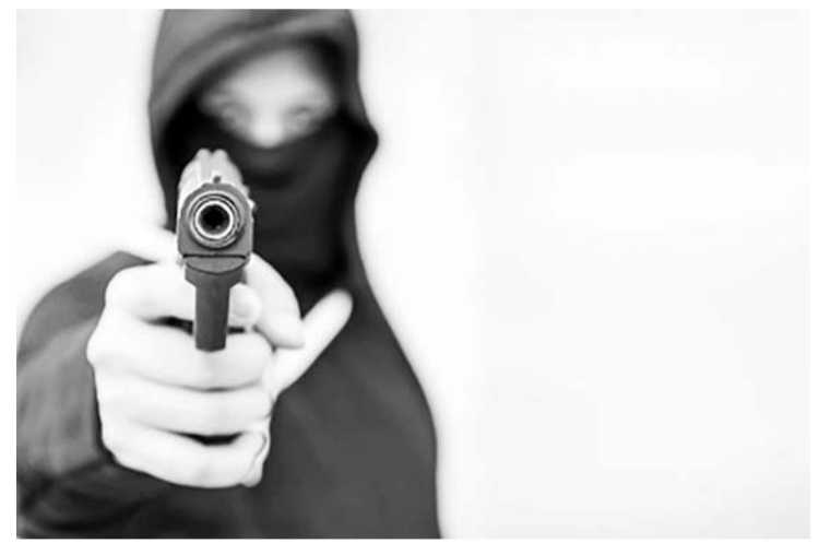
巴厘岛一名土耳其游客遭枪击。

【本报讯】1月23日，巴厘省巴通县(Badung)的特库上尉(Teguh Priyo Wasono)表示，当天凌晨01:30，一名土耳其籍男子TM(30岁)，在巴厘省巴通县(Badung)孟威镇(Mengwi)丹巴帕尤乡(Tambak Bayuh)的一栋别墅中遭三名枪手枪击。在这起事件中，受害人中了五发子弹，伤势严重。左手臂两个洞，腋窝下一个洞，腹部出现两个弹孔。