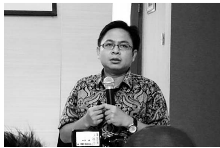
印尼政治指标执行主任布哈努丁(Burhanudin Muhtadi)。

总样本为4560名受访者；从样本基数来看，置信水平为95%，误差幅度约为2%。(亮剑)